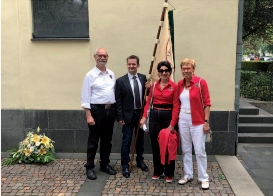
DG-Abordnung bei der Fronleichnam-Prozession und beim Pescher Schützenfest